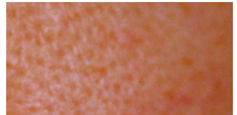
無配合ローション