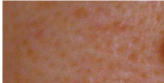
エイジツ抽出液-R 1%配合ローション