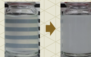
Control レオクリスタ®C-2SP 0.2%

■ ラ・フローラ K-1® の安定保持が期待できる増粘剤 [レオクリスタ®C-2SP 0.2%] [Novethix™ L-10] [Carbopol®Ultrez 21 0.2%] [Carbopol®Ultrez 20] [Pemulen™ EZ-4U]