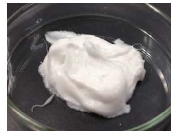
脂肪酸28% 高分子無配合 しっかりとしたペースト