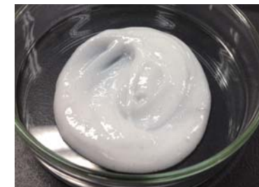
脂肪酸15% 高分子無配合 流動性のある柔らかいペースト