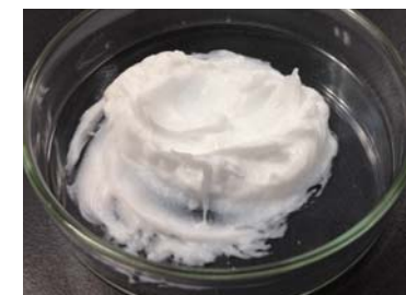
脂肪酸15% SC-200 0.5% しっかりとしたペースト