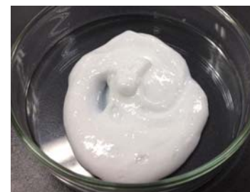
脂肪酸15% HPMC 0.5% 若干流動性する柔らかいペースト